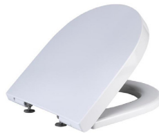
PORCELANOSA. Asiento inodoro Acro Ref. 100123832