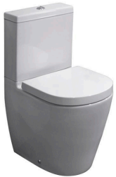
PORCELANOSA. Inodoro Acro Compact Ref. 100160761