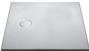
PORCELANOSA. Land Stone+desagüe medidas obra Ref. 100112281