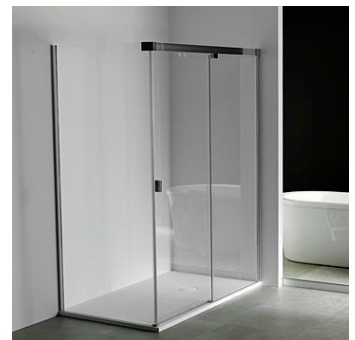
PORCELANOSA. Yove 9C Ref. 100111192