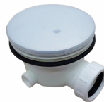
PORCELANOSA. KIP desagüe S/PIP Project Ref. 100060526