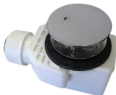
PORCELANOSA. KIT DESAGÜE AUT L-58 Ref. 100060498