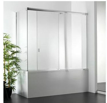
PORCELANOSA. Yove 9B Ref. 10011255