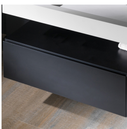
PORCELANOSA. Cajón MB Ras 110 negro Ref. 100154308